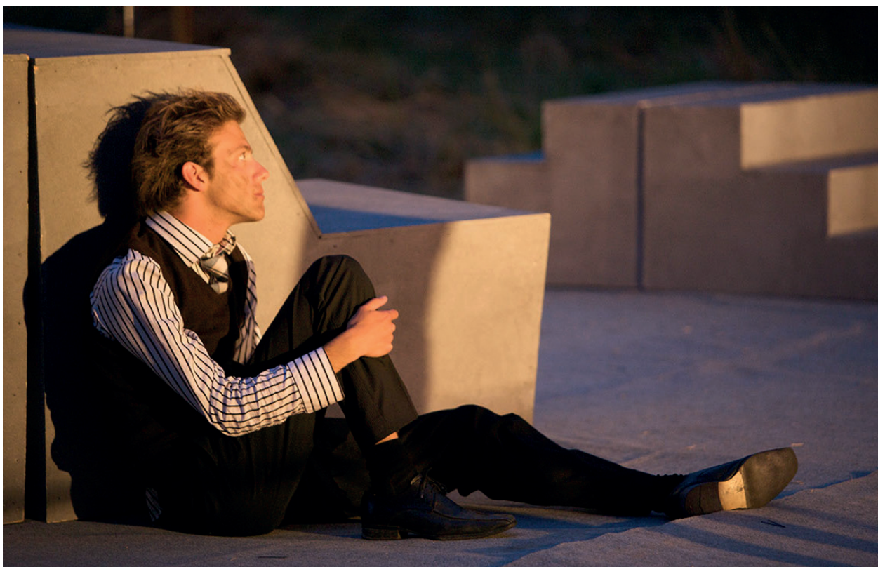
Après la pluie, Sergi Belbel, 2008