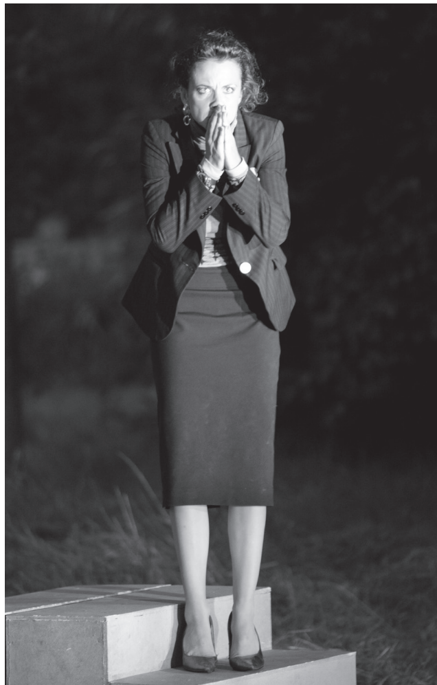
Après la pluie, Sergi Belbel, 2008 © Georges Richeux